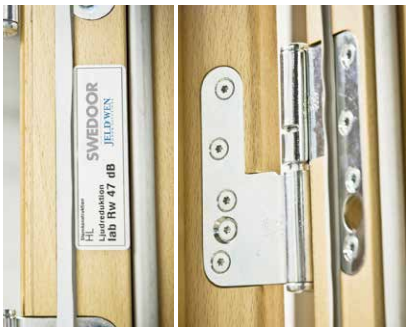
Marknadens bästa ljud- respektive ljud/brandörr med kraftiga tappbärande gångjärn