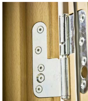
Kraftiga tappbärande gångjärn