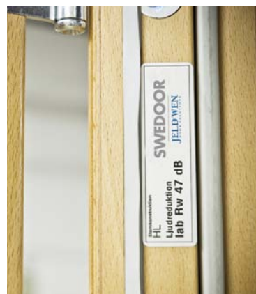
Marknadens bästa ljud- respektive ljud/brandörr